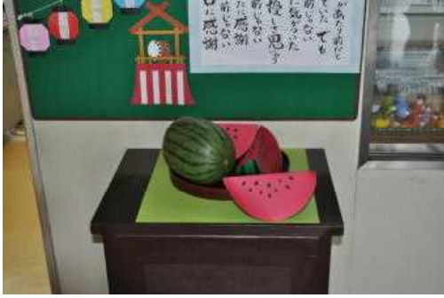
ホンモノそっくり!! (本物も混ざってます)