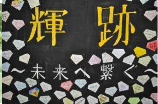
いいねえ…みんなの思いの詰まったスローガン