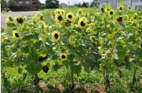
ひまわり迷路、育成快調!