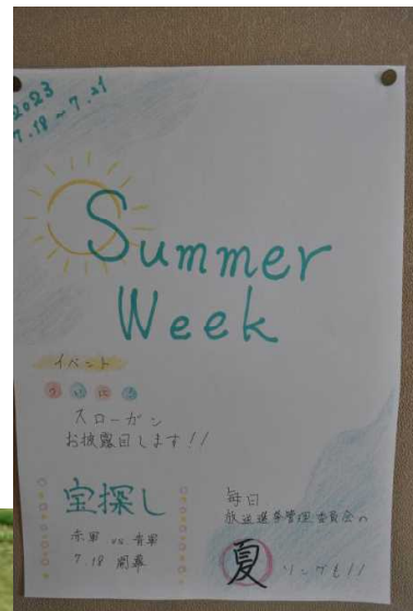
爽やかなポスターです!!