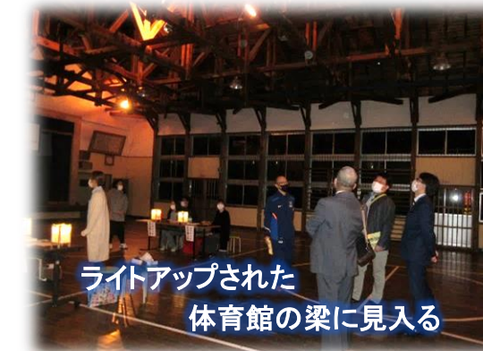
ライトアップされた 体育館の梁に見入る

その気持ちを、11月20日のみのり祭でお伝えします。午後の部は、地域の皆様にも公開いたします。皆様のご来場、お待ちしております。