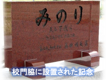
校門脇に設置された記念