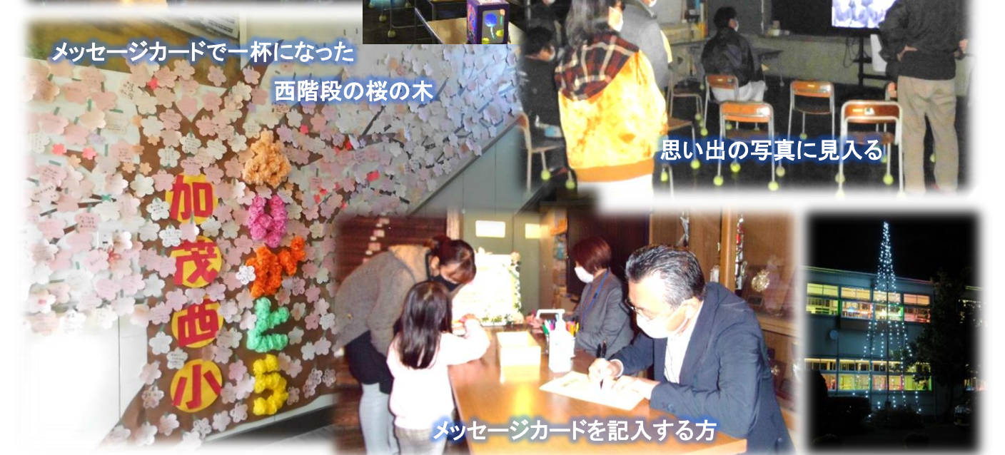
メッセージカードを記入する方