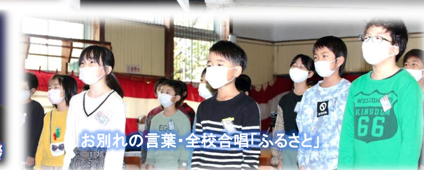
お別れの言葉・全校合唱「ふるさと」