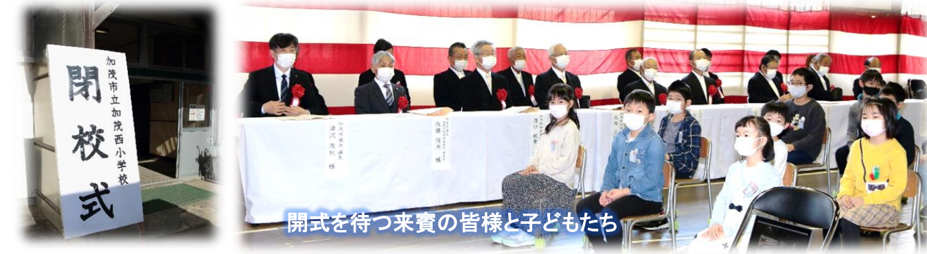
開式を待つ来賓の皆様と子どもたち