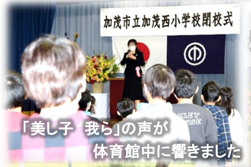
「美し子 我ら」の音が 体育館中に響きました