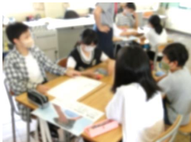
6年生 国語 「インターネットの議論を考えよう」

ご多用の中、学習参観ありがとうございました。例年6月に学習参観は実施していませんでしたが、今年度より6月の学習参観を計画しました。来年度は、この学習参観時に避難訓練を実施し、災害時にお子さんを引き渡す訓練も実施したいと考えています。