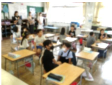
2年生 算数 「1000までの数」