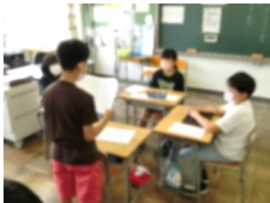
5年生 国語 「環境問題について報告しよう」