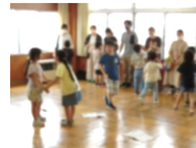
1年生 音楽 「はくを かんじてリズムを うとう」