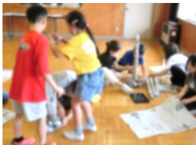
3年生 図工 「新聞タワー」