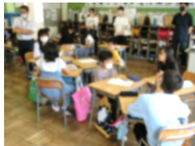
4年生 「新潟県SNS教育プログラム」