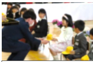
交通安全帽を一人一人に渡していただきました