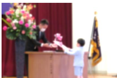
育友会から記念品授与