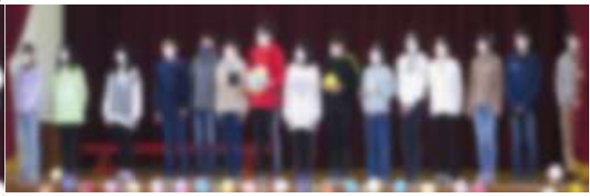
ひまわり班から6年生へ感謝のメッセージが贈られました