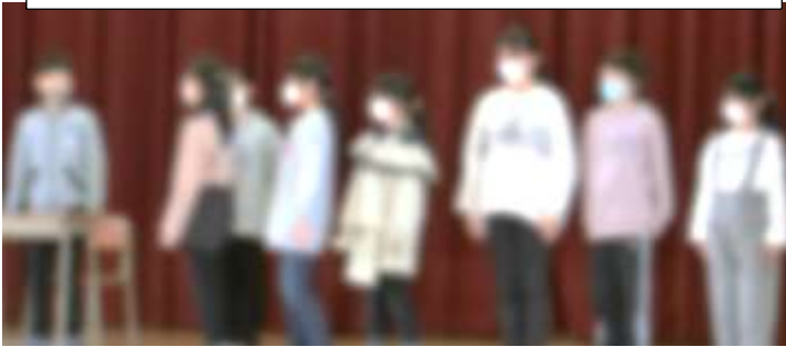
4年生 6年生すごいところを刑事ドラマ風に紹介