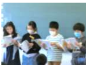
3年生 国語 「すいせんのラップ」