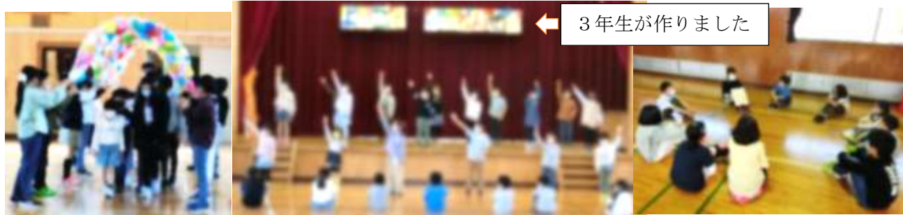
← 3年生が作りました