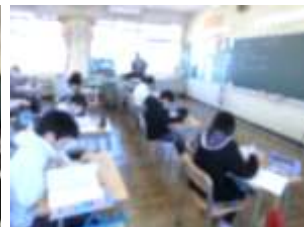
6年生 社会 「暮らしと政治」