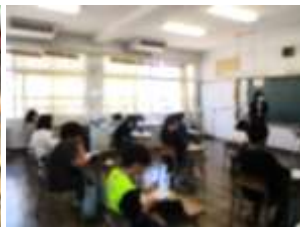
5年生 外国語 「月や日にち」