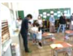
1年生 国語 「あめですよ」