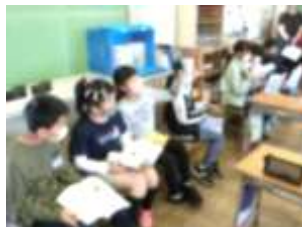
4年生 国語 「こわれた千の楽器」