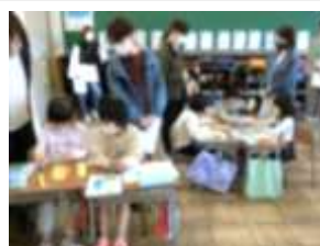
2年生 算数 「たし算の筆算」