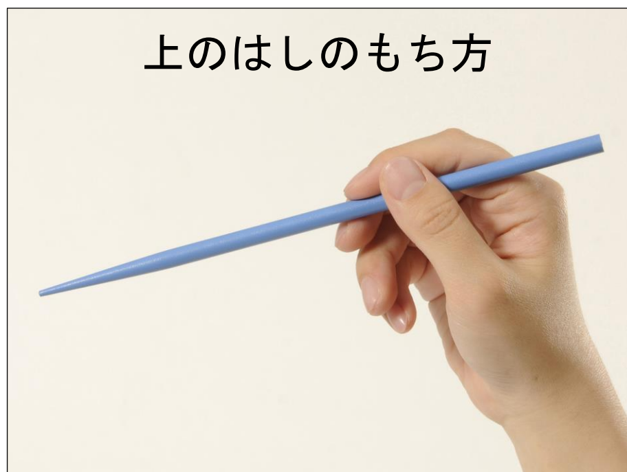
えんぴつを持つように持とう。