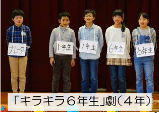
「キラキラ6年生」劇(4年)