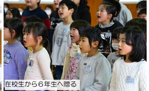
在校生から6年生へ贈る