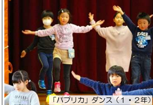
「パプリカ」ダンス(1・2年)

企画=5年生。出演=全校。2月28日の6年生を送る会では、須田っ子がフル出演しました。入場から退場まで、6年生に向き合ったおもてなしの連続でした。 入場の際には、「お立ちリング」の中で、一人一人ポーズを決めた6年生。将来の夢も紹介されました。全校それぞれの役割を果たした素敵な、最後の全校集会となりました。 ※一部動画配信