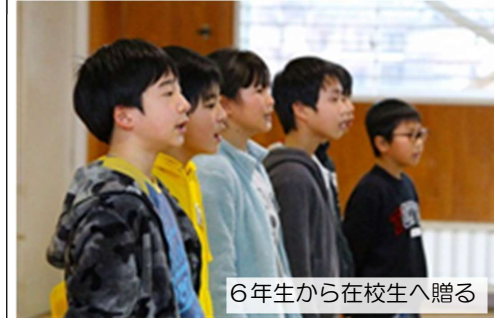
6年生から在校生へ贈る