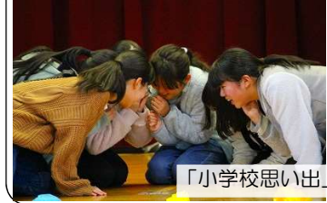
「小学校思い出」劇(6年)