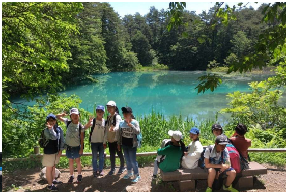
磐梯山の噴火で生まれた造形美(五色沼散策)

6月13日(木)14日(金)の2日間、6年生20名は、会津若松方面に修学旅行に行っていました。2日間、好天に恵まれ、時計とスケジュールを確かめながらの班別活動は、子供にとって大変価値ある体験だったと思います。今後は、2日間の体験を振り返る活動の発展として、これからの自分の考え方や生き方とつなぐ総合的な学習(須田dy科)に発展させていきます。