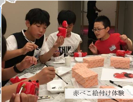
赤べこ絵付け体験