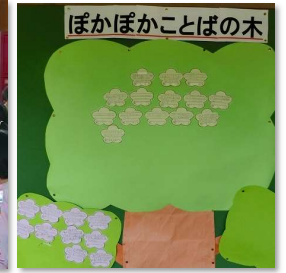
「ぼかぼか言葉の木」