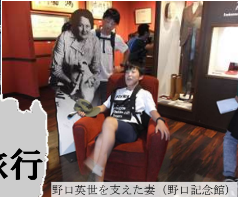
野口英世を支えた妻(野口記念館)