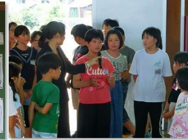
「いじめ見逃しゼロ集会」