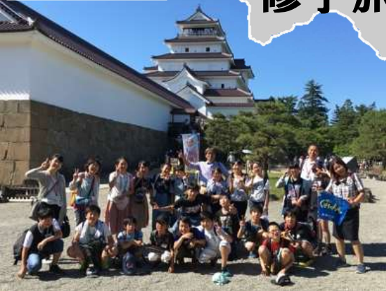
鶴ヶ城前で記念撮影