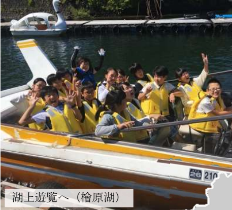
湖上遊覧へ(檜原湖)