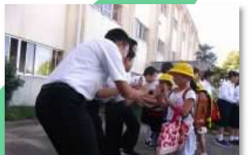
小中あいさつ運動