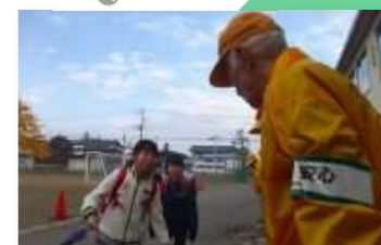
ひまわり会あいさつ活動