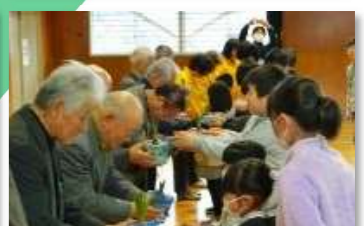
ヒヤシンス贈呈式