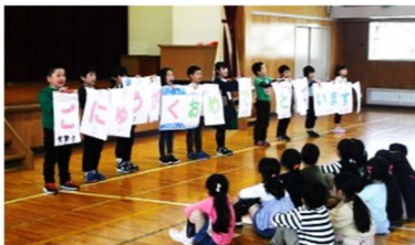
4.21 一年生を迎える会