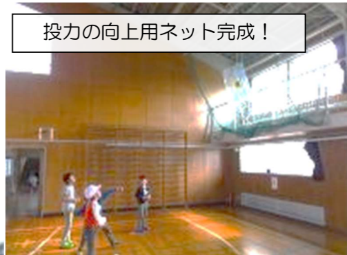
投力の向上用ネット完成!