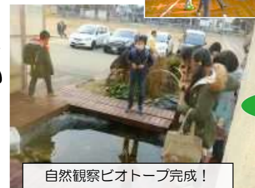
自然観察ビオトープ完成!