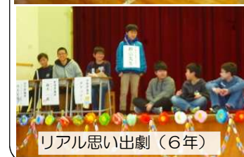
リアル思い出劇(6年)