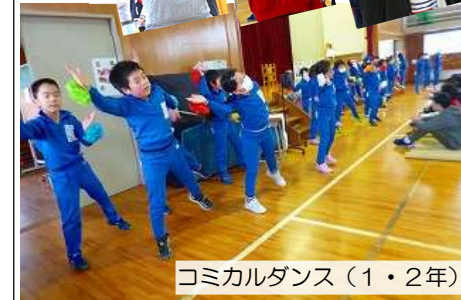
コミカルダンス(1・2年)

企画=5年生。出演=全校。2月28日の6年生を送る会では、須田小劇団がフル出演しました。入場から退場まで「お・も・て・な・し」の連続でした。入場の際には、「お立ちリング」の中で、一人一人ポーズを決めた6年生。将来の夢も紹介されました。それぞれの役割を果たした素敵な会になりました。また、20名以上の保護者の方の参観もありました。ありがとうございました。