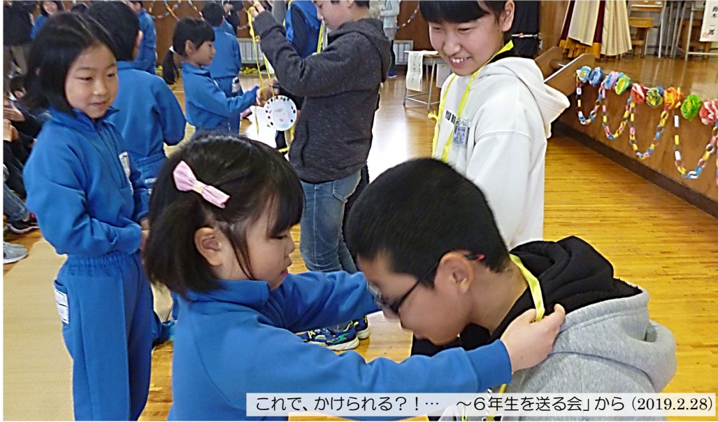
これで、かけられる?!... ～6年生を送る会」から (2019.2.28)

さて、東日本大震災から八年が経ちました。在籍する子供たちの殆どは記憶がありません。災害時の記録映像を見て、被害の大きさの知識を得ることは出来ても、「自分事」として意識することは難しいと感じます。そこで、「当時の人(子供も含め)たちがとった姿」を記憶から呼び起こし話しました。復旧作業の際の声掛け(ハイーありがとう)は互いへの励まし(応援