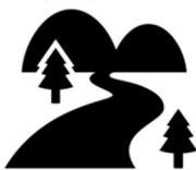
大島頭首工の見学もしました。