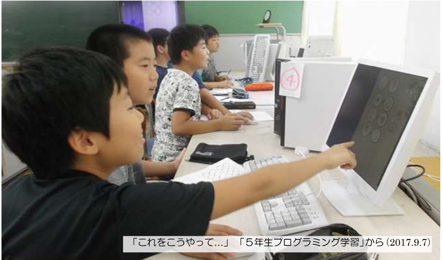
「これをこうやって...」 「5年生プログラミング学習」から (2017.9.7)