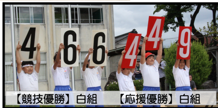
【競技優勝】白組 【応援優勝】白組

「もう少し速く走って。」「バトンをもらう時、腕を肩の高さにして。」私は、小学校生活最後の上学年リレーのアンカー。いつも以上に気合いを入れて臨みました。バトンの受け渡しがいまいちかいたことが多く、授業が終わった後も、チームは残って必死に練習を頑張りました。声を掛けアドバイスをし合いました。そして、本番。みんなのバトンの受け渡しが今まで以上にうまくなっていました。スカッとしました。みんなでつかみ取った1位。最高にうれしかった、小学校生活最後の運動会。忘れられない、いい思い出になったと思います。