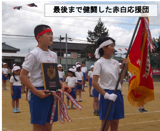
最後まで健闘した赤白応援団