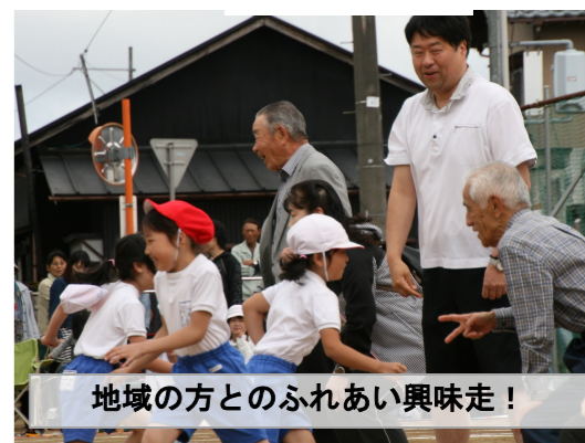
地域の方とのふれあい興味走！