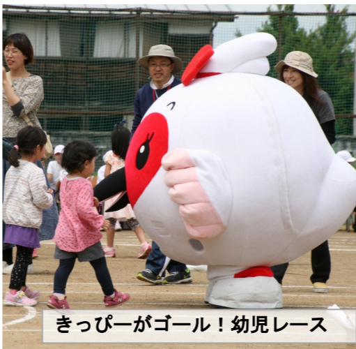
きッピーがゴール！幼児レース