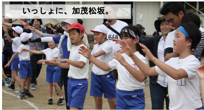
いっしょに、加茂松坂。