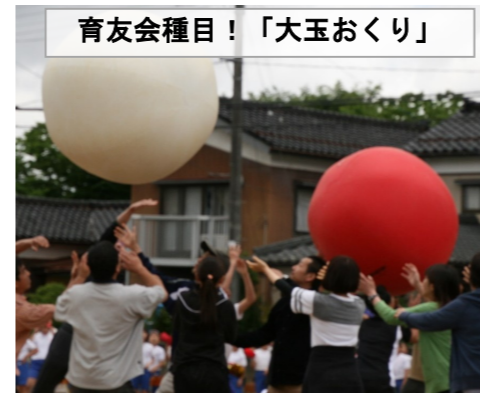
育友会種目！「大玉おくり」