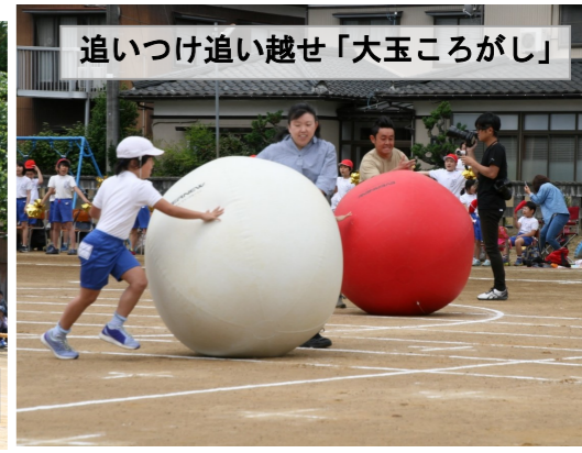
追いつけ追い越せ「大玉ころがし」