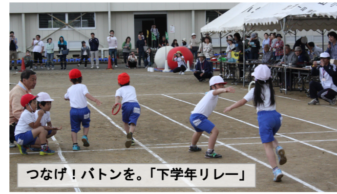
つなげ！バトンを。「下学年リレー」