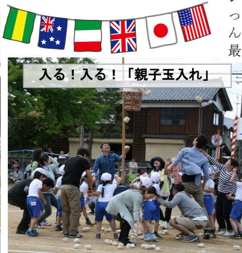
入る！入る！「親子玉入れ」