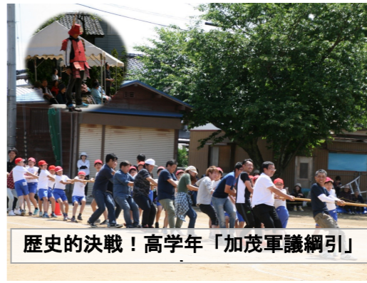
歴史的決戦！高学年「加茂軍議綱引」