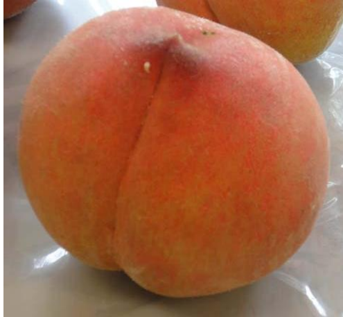
③上海水蜜桃(しゃんはいすいみつとう)