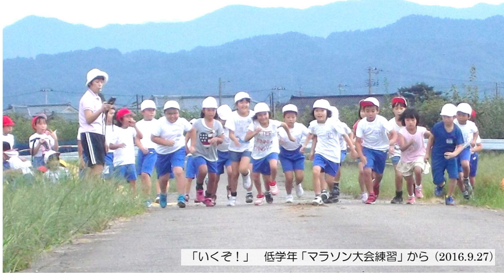
「いくぞ！」 低学年「マラソン大会練習」から (2016.9.27)

言葉には「言葉」が宿っている、と強く感じることがたくさんありました。 背中を押し続けた言葉 二十六日の全校弥彦山登山では、雨交じりの中のスタートで、不安を覚えた子供たちもたくさんいたと思います。そんな中、同じグループの仲間たちからの『がんばろう』の一言が、重い足を山頂まで運んでくれたことが、多くの作文に書かれています。 また、上学年についていくことがよつどの低学年の子供たちは、「大丈夫」という言葉で背中を押され、「来年も頑張る」という気持ちも、作文に書かれていました。 体験から湧き出た言葉 「昨日、できたから最後まであきらめない！」 全校登山の次の日の、低学年のマラソン大会の練習で聞こえてきた言葉です。 十月六日に行われるマラソン大会に向けて、低学年が