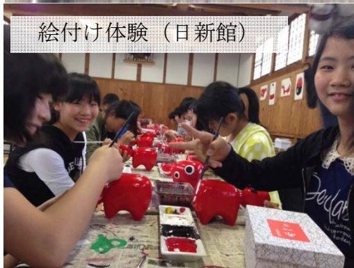
絵付け体験（日新館）