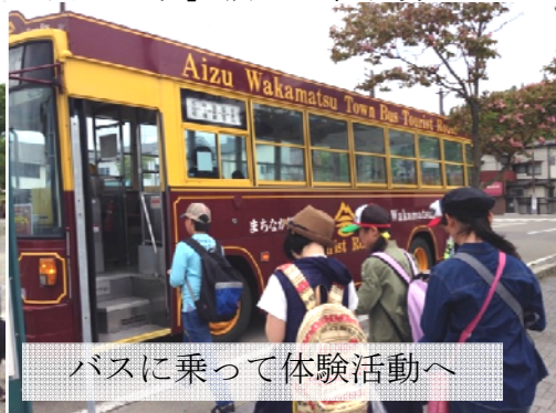
バスに乗って体験活動へ