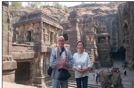
エローラ第16窟 ヒンズー窟 2/26 奥行81m 幅47m 高さ33m 一枚岩の彫刻