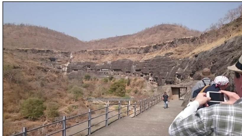
アジャンターの30の石窟群 紀元前1世紀~紀元後6世紀 2/27