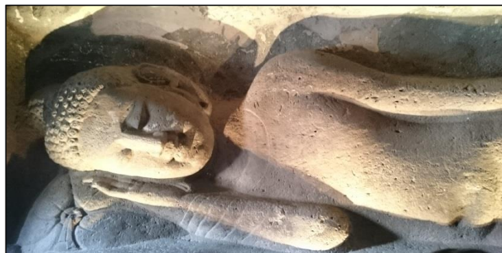
アジャンター第26窟 釈迦涅槃像 2/27

訪龍樹菩薩佛跡 さいてんさんがつぎ 西天三月坐スニ春風ニ りゅうじゆのせいしんごころ 龍樹清心悟ルニ色空ヲ ちようごかいはいとず 鳥語啾啾人不見エ しやうせいいつしよこぎゆう 鐘聲一杵古丘ノ中