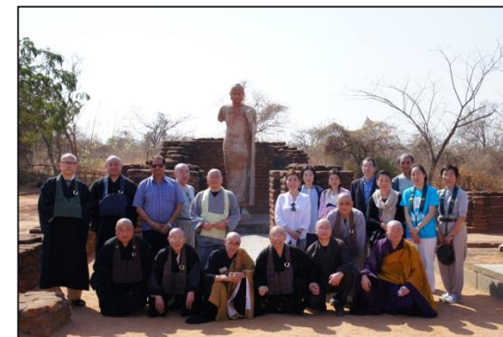
ナーガルジュナコндаにて 2/24