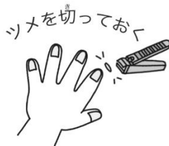
つまを切っておく つまを切っておく