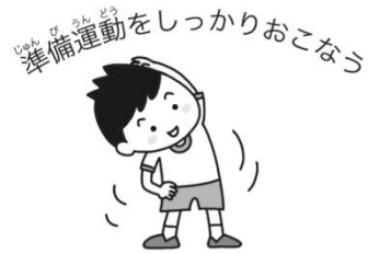
しんびんどうをしっかりとこなう 準備運動をしっかりとこなう