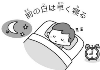
まへのはひはやく寝る 前の日は早く寝る