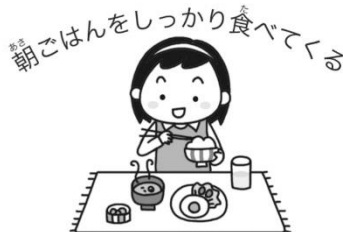
あさごはんをしっかり食べてくる 朝ごはんをしっかり食べてくる