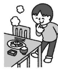
ちようり しよくじ まえ 調理・食事の前