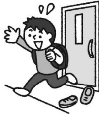
がいしゅつ もど 外出から戻ったとき