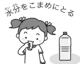
みづをこまめにとる 水分をこまめにとる