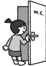
い あと トイレに行った後