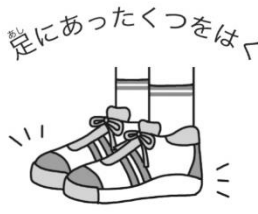
足にあつくつをはく 足にあつくつをはく