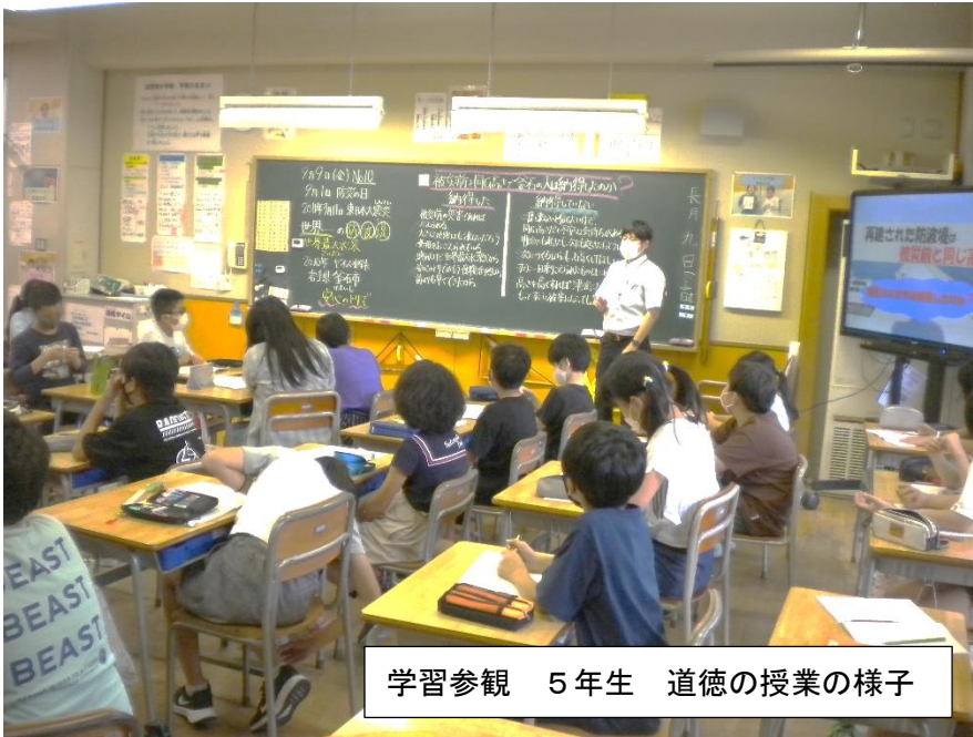
学習参観 5年生 道徳の授業の様子