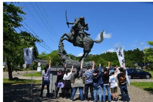
埋蔵文化財センターにて

ホテルーロッテアライリゾート(ツリーアドベンチャー・チュービング・ジップライン・プレイグラウンド・昼食・コアラ探し)ー到着式