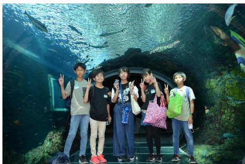
「うみがたり」では班別行動 今年はお土産の購入もOK。