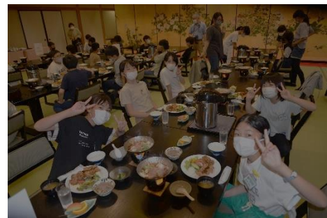
楽しみな友達との一泊 ホテルにて