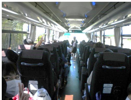
バスの中も楽しみのひとつ

先週から、当校児童に、複数の新型コロナウイルス感染者が出ています。今後の感染状況によっては予定を変更する場合があります。 熱中症予防と新型コロナウイルス感染予防の両方にご協力ください。