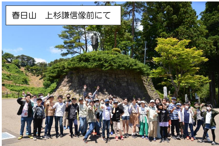
春日山 上杉謙信像前にて