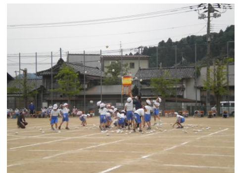
低学年 紅白玉入れ