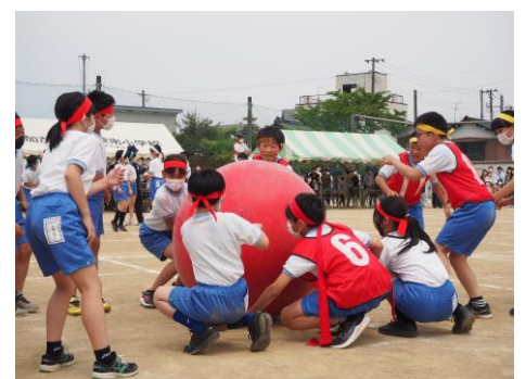
高学年 大玉転がし&リレー