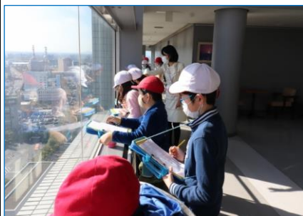
佐渡も粟島もよく見えました

天候にも恵まれ、バス2台で県庁に向かいました。到着して、県庁内の施設を見学しながら、それらの説明を聞きま