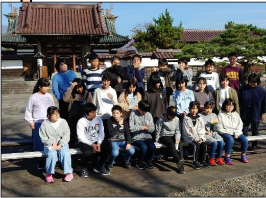
日新館前にてパシャ！