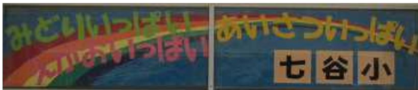
【新しい児童玄関の飾り】

そして、3月はお世話になった先生や6年生と別れる月です。全校や学級で「会」や「式」などの行事を通して、1年の成長や共に汗した喜びを振り返りながら次の新しい出会いに向けた準備を進めていく月です。残念ながら、新型コロナウイルスの影響で十分な時間はありませんでした。