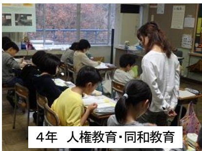
4年 人権教育・同和教育