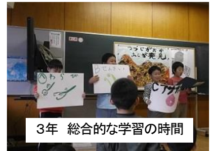
3年 総合的な学習の時間